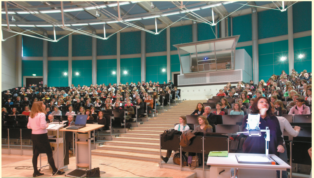
Das Audimax beim Schnuppertag Romanistik

(wie beispielsweise Informatik oder Rechtswissenschaften), Berufspraktika und integrierte Auslandssemester zur Vertiefung der Sprachenkompetenz und der internationalen Mobilität.