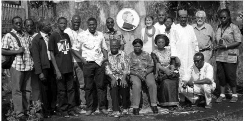
Teilnehmer des DAAD-Alumni-Workshops in Buea, Dezember 2009, am historischen Bismarck-Brunnen des ehemaligen Verwaltungssitzes der deutschen Kolonie Kamerun

DAAD fördert die Bindung ausländischer Alumni an die Universität Bayreuth