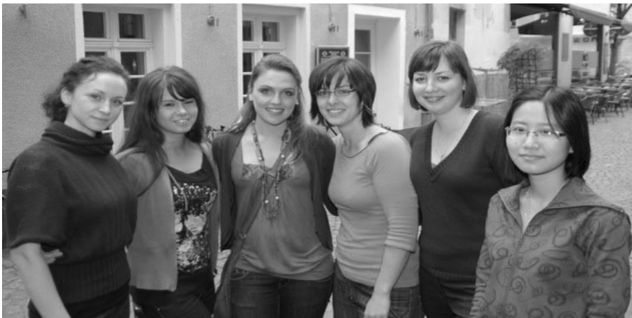
Der Arbeitskreis „sabig“ verbindet Alumni und Studierende der Bayreuther Interkulturellen Germanistik